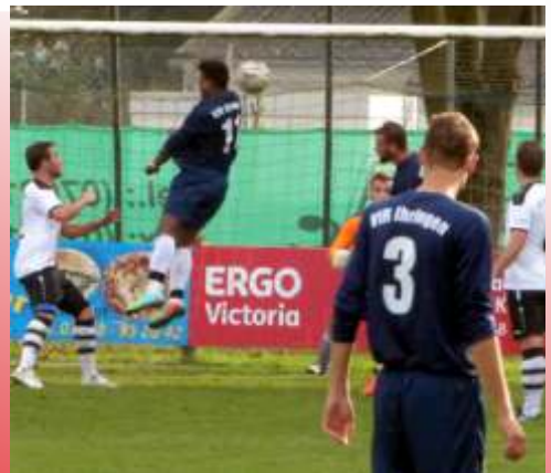
die entscheidende Szenen zum glücklichen Unentschieden für die Ihringer