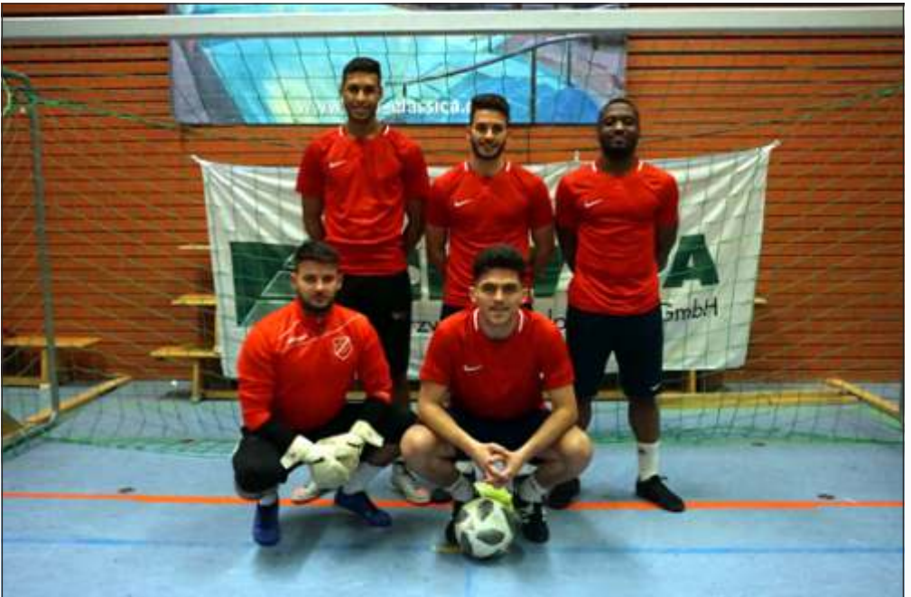
Beim Betriebsmannschaftenturnier am 11.01 konnte sich wieder der Sieger vom letzten Jahr Ozan Organisation mit einem überzeugendem 4:1 Sieg gegen die Fa. voestalpine Böhler durchsetzen