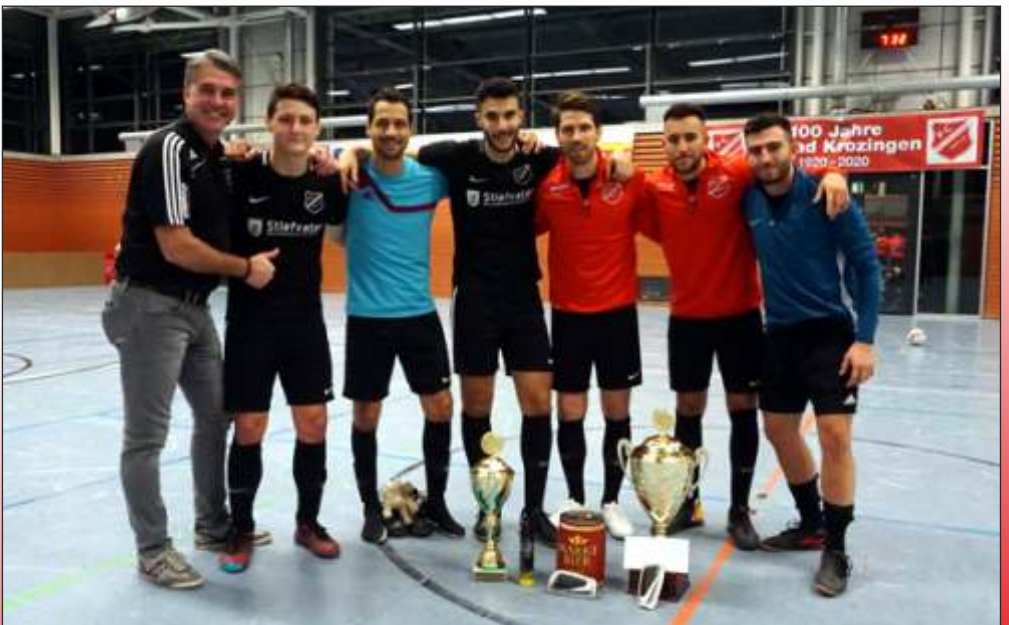
Unsere 1. Mannschaft konnte beim Aktivturnier im Endspiel mit einem klaren Sieg gegen den letztjährigen Sieger FC Freiburg St. Georgen das Turnier gewinnen