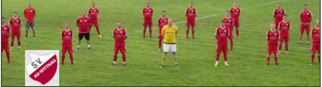
Mannschaftsbild von Saison 2020/21